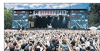
Im Sommer 2012 wieder im Stuttgarter Reitstadion: Hip-Hop Open promo