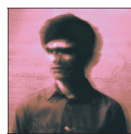
James Blake Limit To Your Love (Universal)

Die Songs des Jahres: Traurigkeit ist ein Segen – Die besten Lieder kamen 2011 von James Blake, M83, Lykke Li und Casper