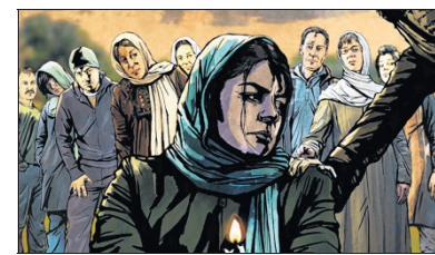
Animation als Stilmittel: Szene aus „The Green Wave“