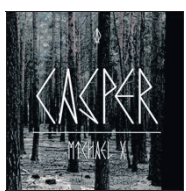
Casper

Dieses Lied kam aus dem Nichts. Es war auf einmal da. Wie von Zauberhand. Die Klänge der Synthesizer zu Beginn sind so einprägsam, dass man sie nur nach einem Mal hören immer wieder erkennt. Das ist schon die erste, wahnsinnig große Leistung dieses Songs von M83. Und: Er funkelt. Er glitzert, und er ist nicht wirklich einzuordnen. Wer singt da? Und über was? Die Band besteht aus zwei Franzosen, aus Nicolas Fromageau und Anthony Gonzalez, die M83 bereits im Jahr 2000 gegründet haben. Es dauerte über zehn Jahre, bis sie einen Song wie „Midnight City“ veröffentlichten. Manche schaffen das nie.