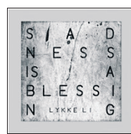
Lykke Li Sadness Is A Blessing (Warner)

Zu einem melancholischen Klaviermotiv, einem sanften Gitarrenstaccato erinnert er sich an einen, der das Leben nicht mehr aushält: „Jedes Mal wenn der Wind pfeift und durch Äste weht / Bilden wir uns einfach ein, du willst nur nach dem Rechten sehen / Dann warst du kurz zu Besuch, leider nur zu Besuch / Hoff, es geht dir gut, da wo du bist.“ Eher nach Rezitativ als nach Rap klingt das, was sich Casper in „Michael X“ zusammenreimt und womit er eine Welt erschließt, in der es für Bruce Springsteen und für Tupac Shakur Platz gibt. So ergreifend und durchdringend klingt deutscher Sprechgesang nie zuvor.